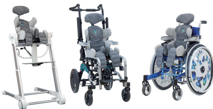
Regolazione larghezza seduta