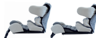
Regolazione altezza schienale